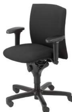
B - 270