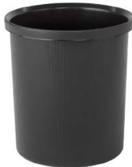
200 / 54