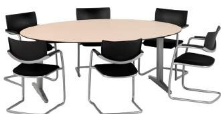
200 / 15