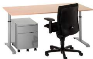
200 / 4