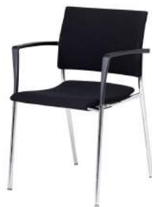
V - 360