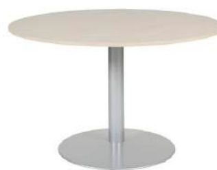
200 / 16