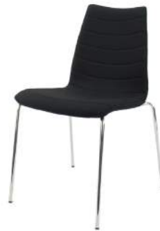
V - 340