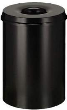
200 / 53