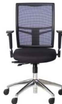
B - 240