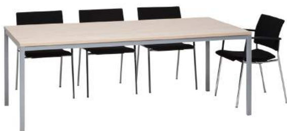
200 / 13