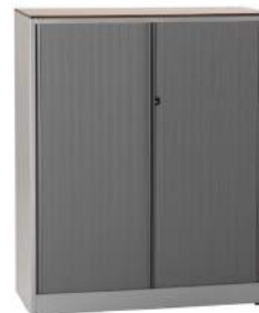
200 / 33