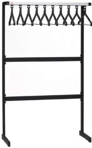
200 / 51