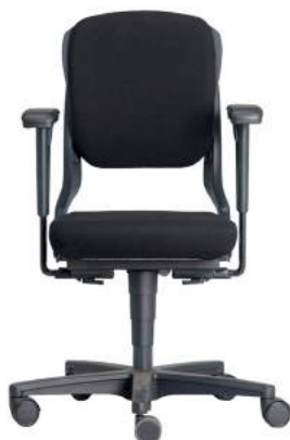
B - 230