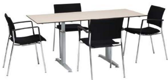
200 / 11