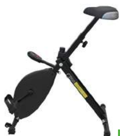
200 / 42