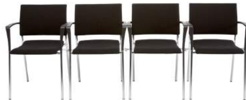
200 / 44