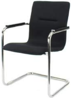
V - 320