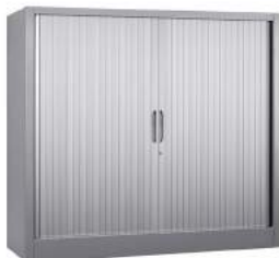
200 / 32