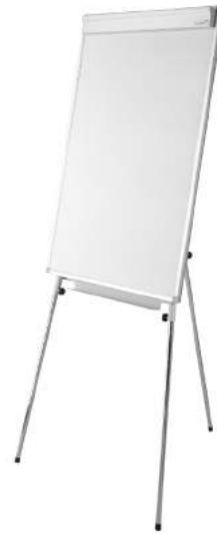
200 / 52