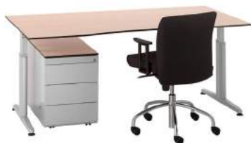
200 / 1