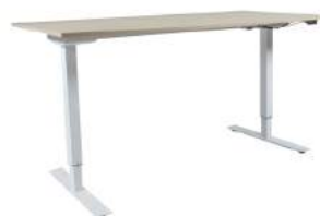
200 / 9