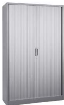
200 / 34