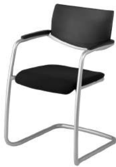
V - 330