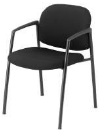
V - 350