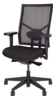
B - 250