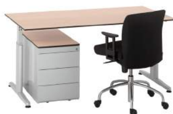
200 / 5