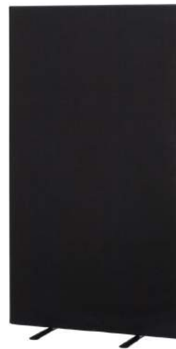
200 / 55