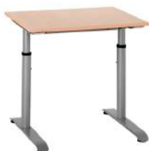
200 / 8