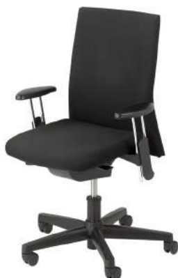
B - 260