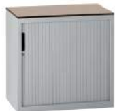
200 / 31