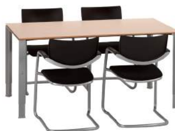
200 / 12