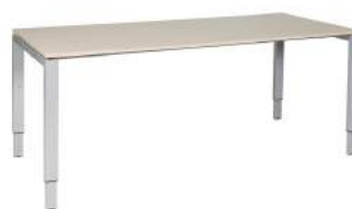
200 / 7