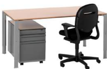
200 / 6