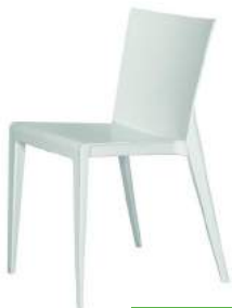
200 / 45