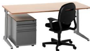
200 / 2&amp;3