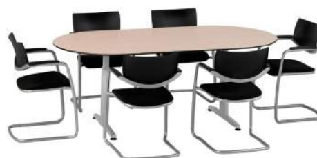
200 / 14