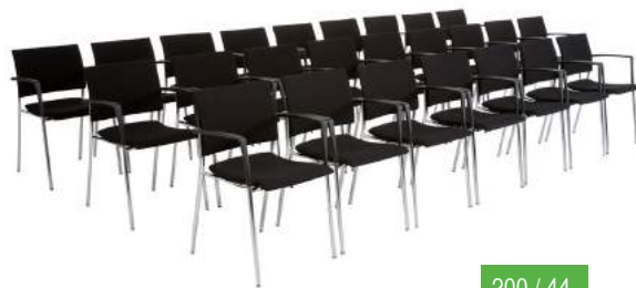
200 / 44