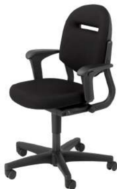
B - 220