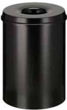
200 / 53