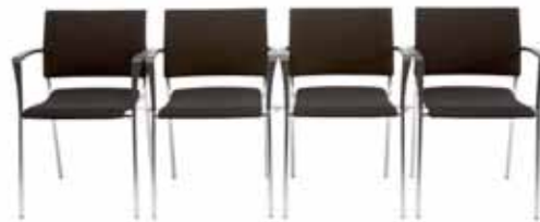
200 / 44