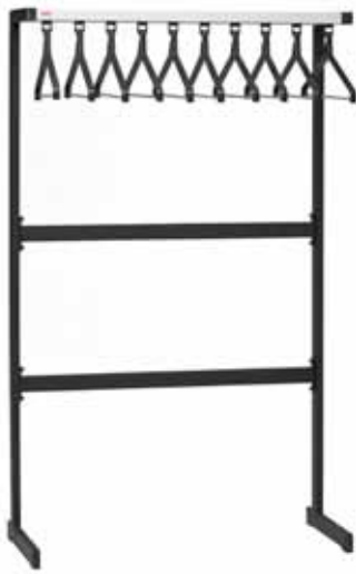
200 / 51