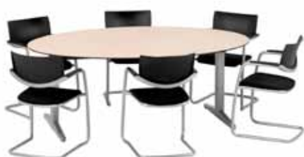
200 / 15