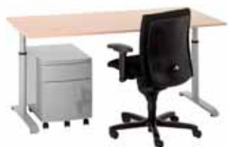
200 / 4