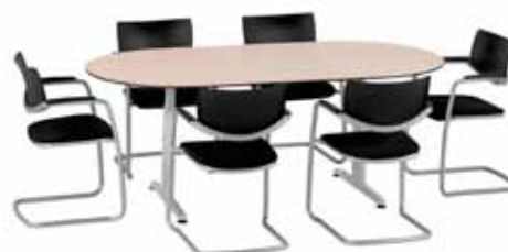
200 / 14