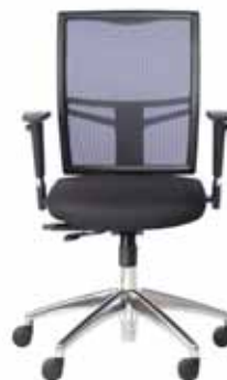
B - 240