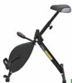
200 / 42