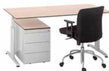
200 / 5