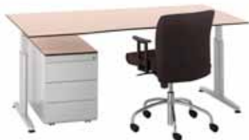
200 / 1