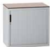
200 / 31