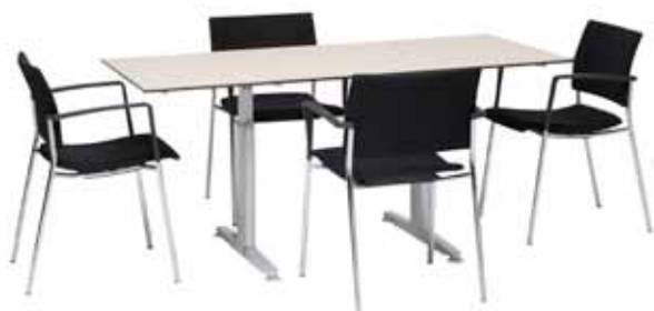
200 / 11