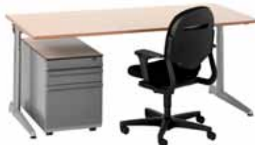
200 / 2&amp;3