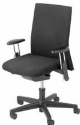
B - 260