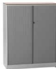
200 / 33