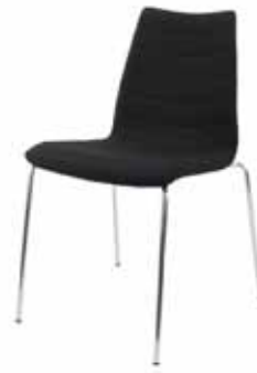
V - 340