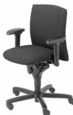
B - 270