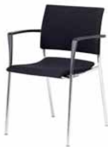
V - 360