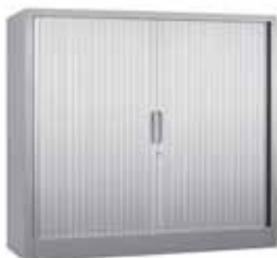
200 / 32