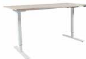
200 / 9