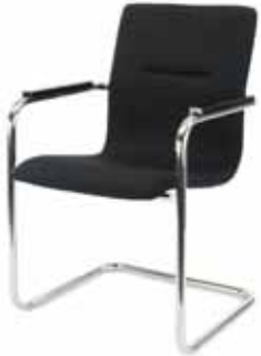
V - 320