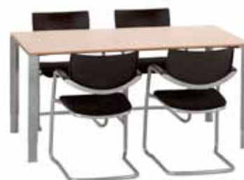
200 / 12