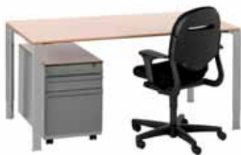
200 / 6