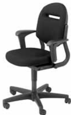
B - 220