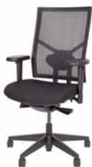
B - 250