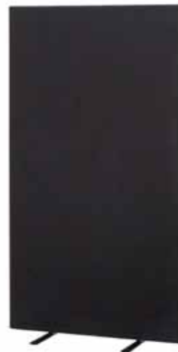
200 / 55