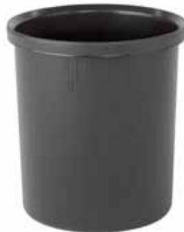
200 / 54