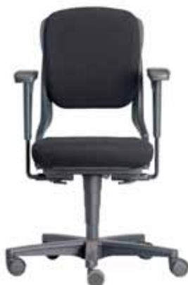
B - 230