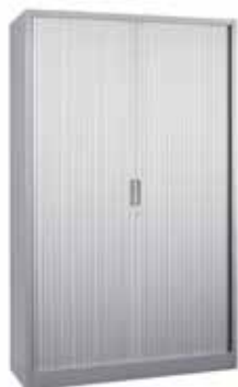
200 / 34