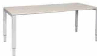
200 / 7