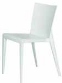
200 / 45