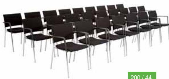
200 / 44