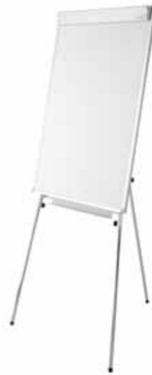
200 / 52