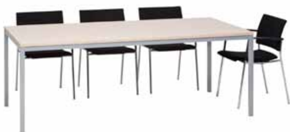
200 / 13