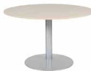
200 / 16