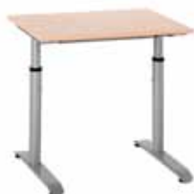
200 / 8