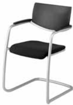
V - 330